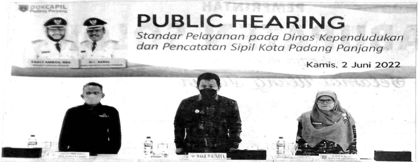
PUBLIC Hearing Standar Pelayanan Publik pada Disdukcapil Kota Padangpanjang.