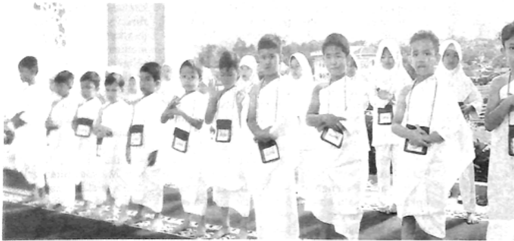
PANTASIAS —Sebanyak 60 murid Taman Kanak Kanak (TK) yang merupakan gabungan dari TK Smart Kids, TK Harapan dan TK Asih Putra antusias ikuti kegiatan Manasik Haji di halaman Masjid Islamic Center, Kamis (2/6).