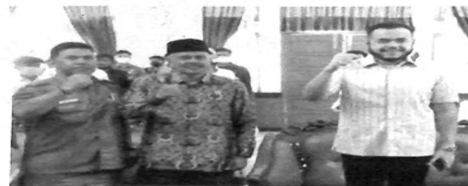
Wali Kota Padang Panjang Fadly Amran buka acara pelatihan kepemimpinan untuk generasi muda.

Berbicara soal pembelajaran, wali kota muda itu mengatakan, tidak ada yang sekali